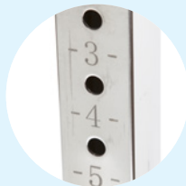
Réglages gradués précis