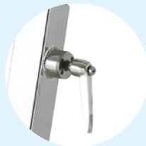
Réglages rapides Click & Turn