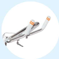
Guidon Sport 45°