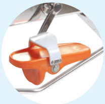
Confort pieds nus

Le Système Spinning Pro 2 du WR5 permet de régler la résistance mécanique au pédalage. Ajustez la difficulté d'exercice et personnalisez l'effort depuis la position assise en tournant la molette . Simple et efficace, l'effort est accentué. Un frein tampon vient agir sur une roue en acier inoxydable 316L de qualité marine pour une efficacité inégalée.