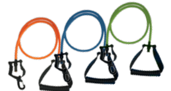
ÉLASTIQUES 3 RÉSISTANCES AU CHOIX