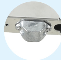
Anode sacrificielle pour usage marin